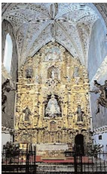
Convento de Concepción Retablo Mayor y Bóveda. ▲