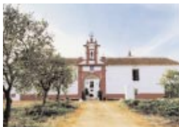
▲ Hacienda La Nava.