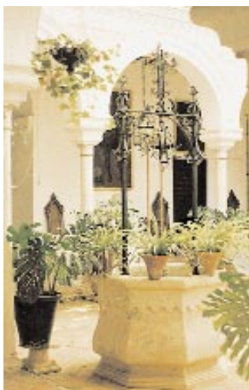
Casa Palacio Marqués de las Torres. Patio central. ▼