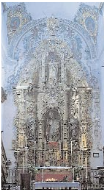
Iglesia de San Blas. Retablo Mayor. ▲

Tel.: 95- 419 16 96 o contactar con la Oficina de Turismo de Carmona.