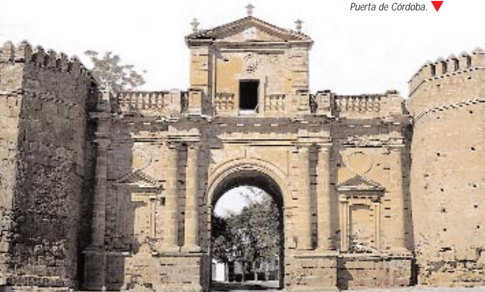
Puerta de Córdoba. ▼

En el interior de la Iglesia destaca el Retablo Mayor, cuyo altar se encuentra presidido por una imagen de la Inmaculada Concepción, obra del s. XVI así como el Altar del Cristo de la Vera Cruz y la Virgen de las Lágrimas. En el Coro se conserva un interesante altorrelieve de Jesús Nazareno, atribuido a Gaspar del Águila de finales del s. XVI, así como una colección de niños Jesús donados por las novicias a su entrada en el convento.