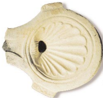
▲ Lucerna romana.

Aunque el aspecto que hoy conocemos de este magnífico bastión comenzó a gestarse entre el s. III y II a.C., se tienen datos ciertos de fortificaciones en esta zona entre los s. XIV y XII a.C. Fueron los cartagineses los que comenzaron la construcción de este complicado complejo defensivo, siendo posteriormente reforzado por los romanos, que añadieron la puerta que aún hoy conocemos en su cara interior, con sencillos arcos de medio punto. Entre los s. IX y XII se construyeron los aljibes, muros y barbacanas con sus puertas, así como la puerta exterior, con su arco de herradura apuntado, que ha llegado hasta nosotros.