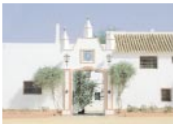
Centro Ecuestre Epona. ▲