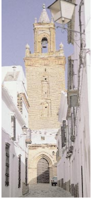
Iglesia de San Felipe. ▲

De origen romano (s. I), la planta consiste fundamentalmente en un muro recto de sillería almohadillada, de unos diez metros de altura, flanqueado por dos torres militares defensivas de planta octogonal; rematadas de almenaje y de construcción romana fueron ampliamente reformadas en el s. XVIII, de ahí su aspecto neoclásico. Es la única puerta romana de la península con carácter defensivo que posee tres vanos.